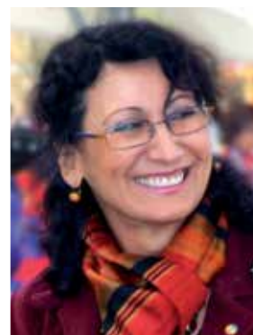
La sindaca MARIA FERRUCCI

E così il volontariato urbano per la cura e il decoro sta trasformando in opportunità quei vincoli in cui la crisi ha ridotto i bilanci comunali, stretti tra tagli ai trasferimenti e patto di stabilità, e a Corsico sta facendo riemergere il vero spirito di una città solidale e generosa, accogliente e civicamente impegnata, una città “col cuore in mano”.